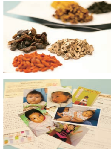
(左) 漢方薬は一度飲んでみて、納得したうえで決めることができます。(右上) 写真のような煎じ飲むものや粉薬などさまざまなタイプがあります。(右下) 全国から赤ちゃん誕生の報告が届いています。